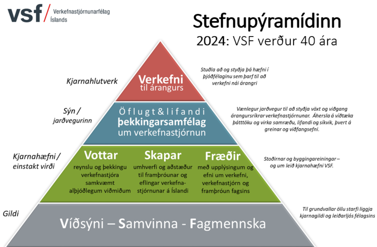
Mynd 4 Stefnumörkun VSF, sem varð til úr vinnu sem hófst 2014. Verður hann enn í gildi 2024?

Fyrir 10 árum, á starfsárinu 2013, hófst undirbúningur að afmælisárinu 2014, þegar félagið varð 30 ára. Niðurstaðan af þeim undirbúningi skilaði sér með ýmsum hætti; sérstakur afmælisfögnuður var haldinn, merki félagsins endurhannað og bók skrifuð um sögu félagsins svo eitthvað sé nefnt. Einnig var ráðist í heilmikla stefnumótunarvinnu sem skilaði sér í stefnupýramíða félagsins.